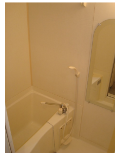
* 室内写真が異なる場合は、現状を優先致します。