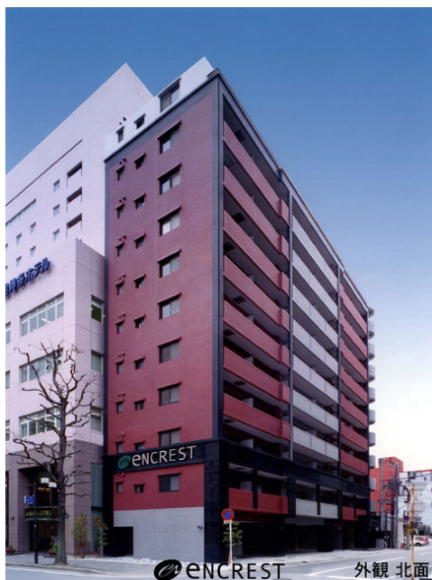
enCREST 外観 北面