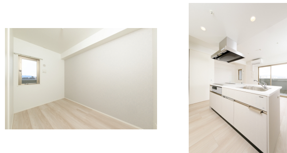
* 室内写真が異なる場合は、現状を優先致します。