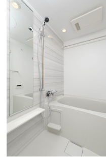
* 室内写真が異なる場合は、現状を優先致します。