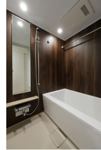
* 室内写真が異なる場合は、現状を優先致します。