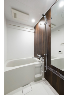
* 室内写真が異なる場合は、現状を優先致します。