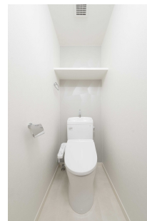
* 室内写真が異なる場合は、現状を優先致します。