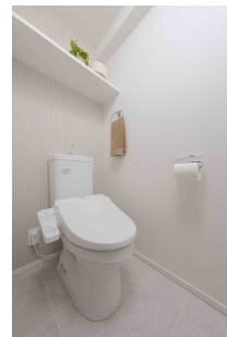
* 室内写真が異なる場合は、現状を優先致します。