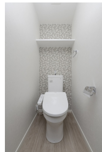
* 室内写真が異なる場合は、現状を優先致します。