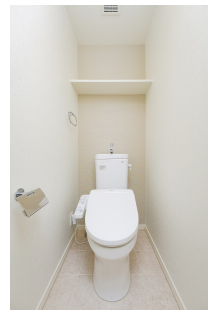
* 室内写真が異なる場合は、現状を優先致します。