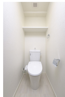
* 室内写真が異なる場合は、現状を優先致します。