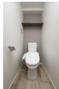
* 室内写真が異なる場合は、現状を優先致します。