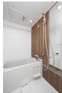
* 室内写真が異なる場合は、現状を優先致します。