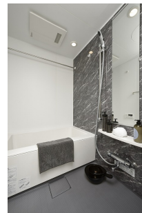
* 室内写真が異なる場合は、現状を優先致します。