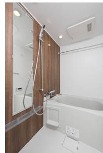
*室内写真が異なる場合は、現状を優先致します。