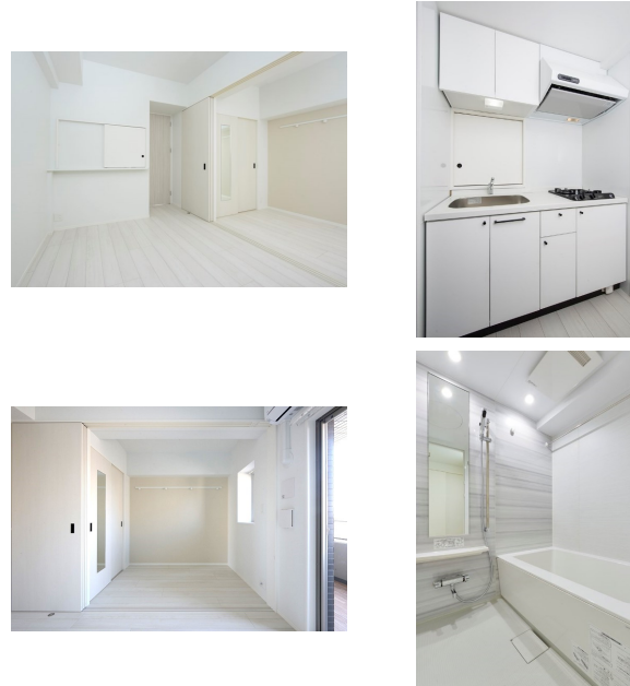
* 室内写真が異なる場合は、現状を優先致します。