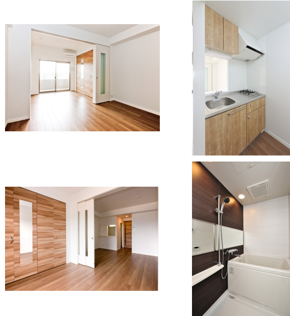
* 室内写真が異なる場合は、現状を優先致します。